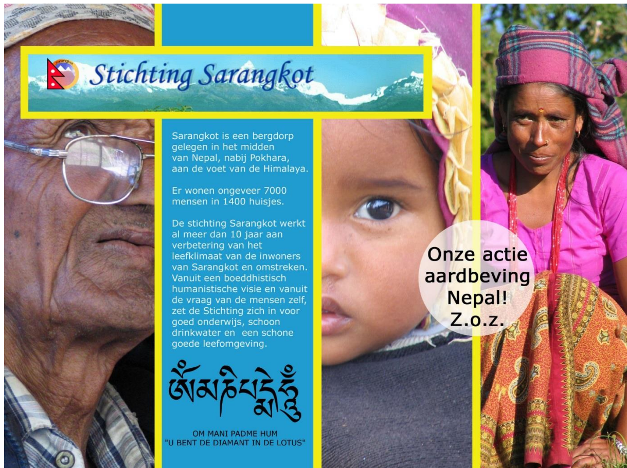
Achterzijde folder Sticchting Sarangkot 2017